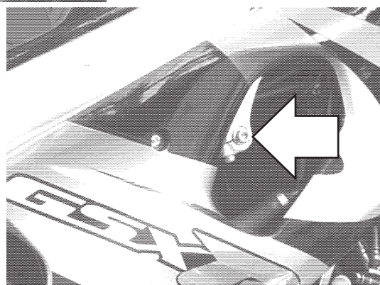
Miejsce montażu Prawa strona.