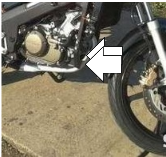
Miejsce montażu (obie strony)