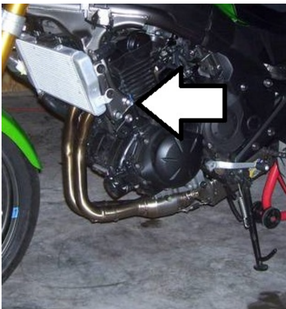
Miejsce montażu (obie strony)