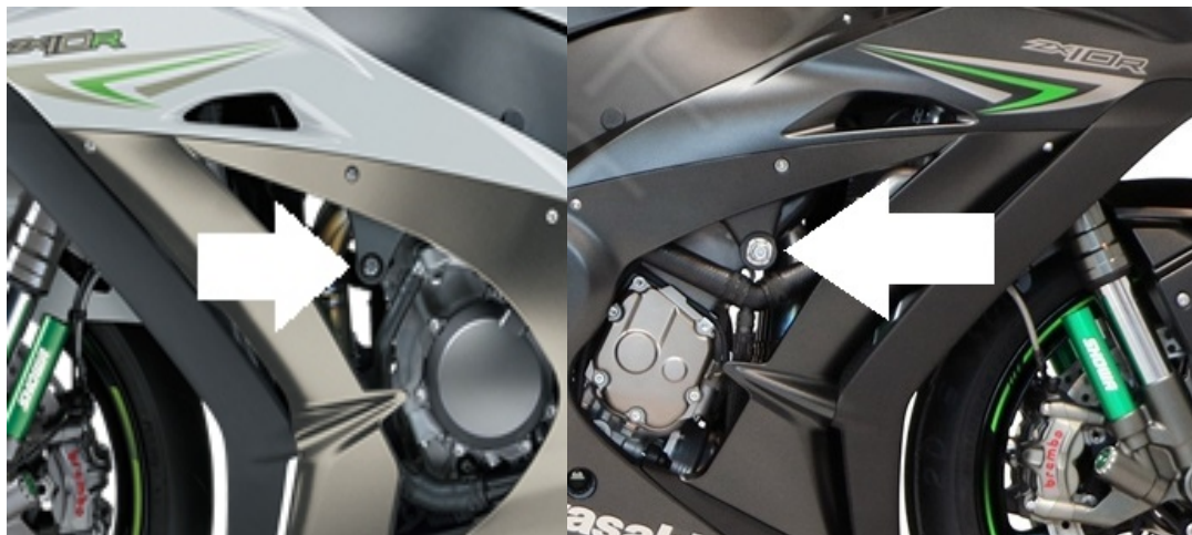
Miejsce montażu (lewa strona)

lata produkcji: '16- kod produktu: N10235