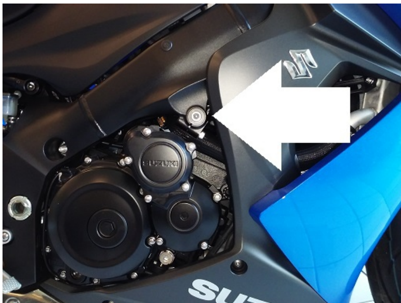
Miejsce montażu (obie strony)