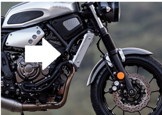
Miejsce montażu (obie strony)