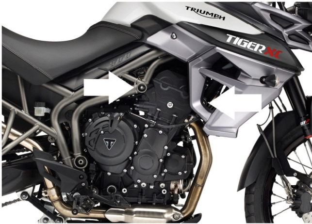
Miejsca montażu (strony lewa i prawa)