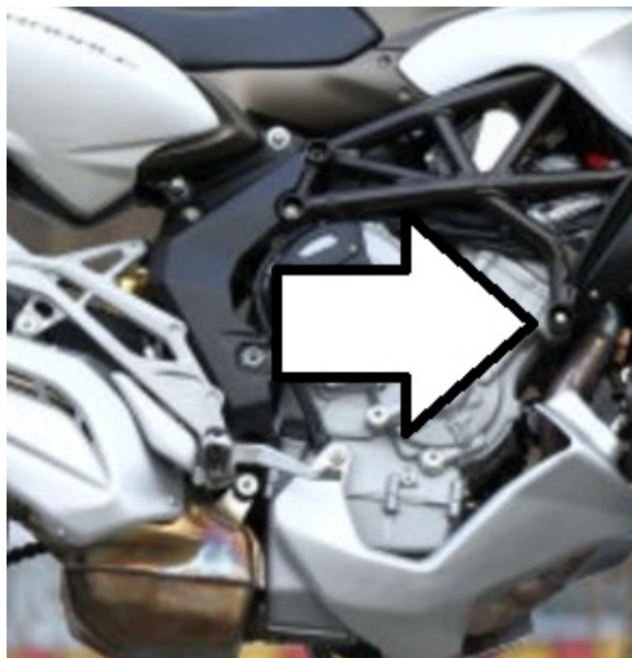
Miejsce montażu (obie strony)