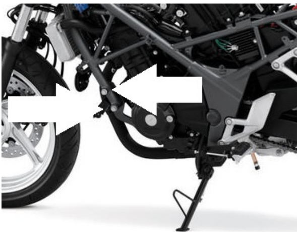
Miejsce montażu (obie strony)