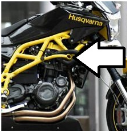
Miejsce montażu (obie strony)