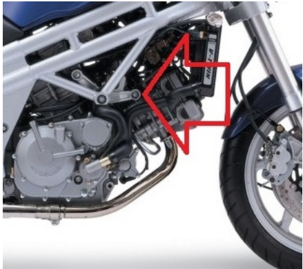
Miejsce montażu (obie strony)