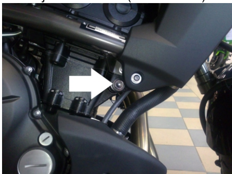
Miejsce montażu (lewa strona)