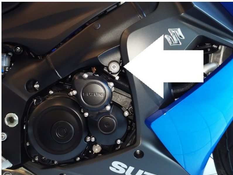
Miejsce montażu (obie strony)