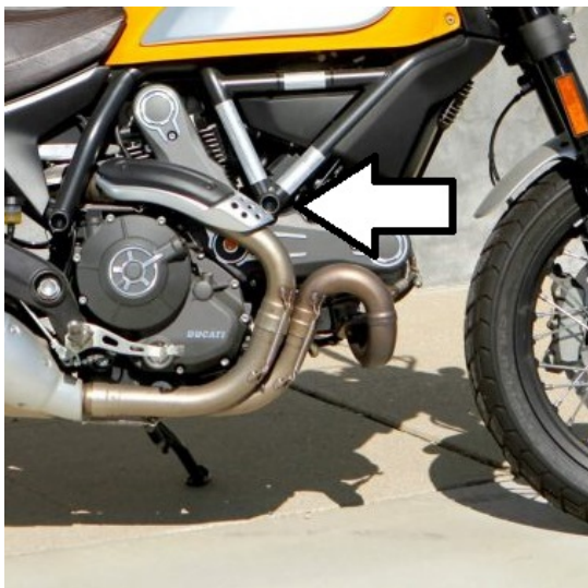
Miejsce montażu (obie strony)