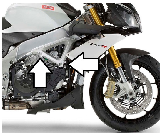
Miejsce montażu (obie strony)