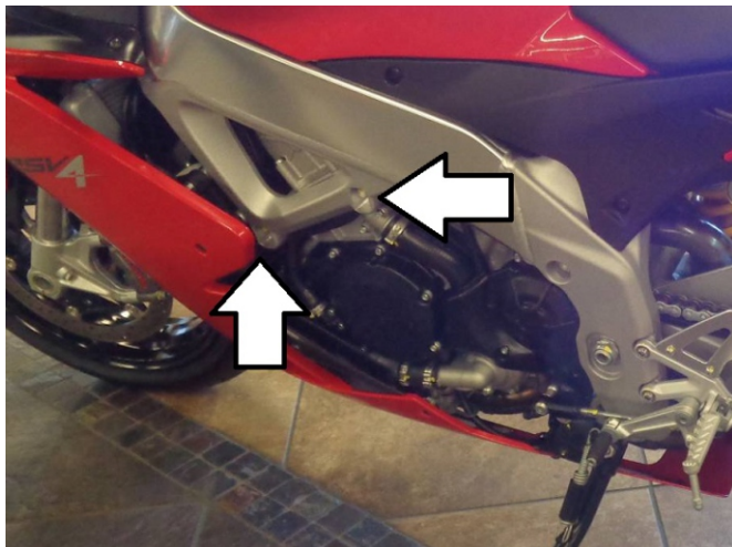
Miejsce montażu (obie strony)